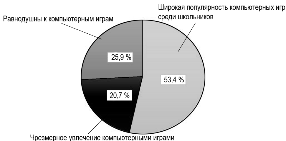
Рис. 1. Распределение респондентов по уровню кибераддикции

Таким образом, исходя из полученных результатов, можно предположить, что скорость обработки информации V и точность обработки информации k снижаются с увеличением степени кибераддикции.