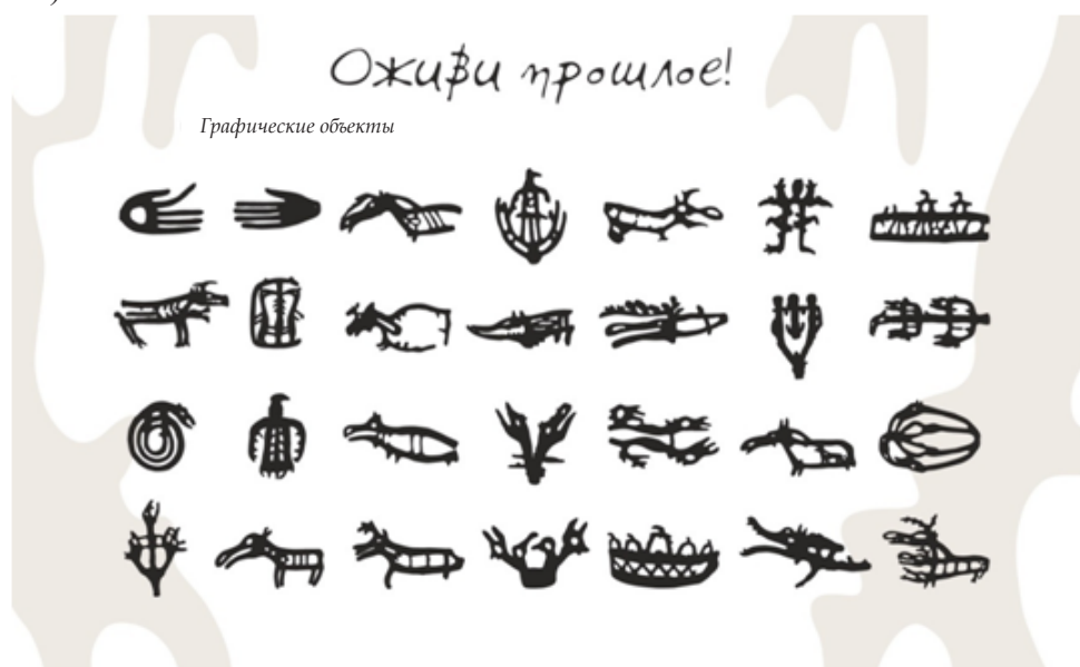
Рис. 2. Слоган и графические объекты

Восстановить связь времен, показать, что сибирская земля богата историческим прошлым, – основные задачи проекта. Идею обращения к историческому наследию Томска и призыв принять участие в процессе придания современного звучания культуре древних цивилизаций отражает слоган «Оживи прошлое!» в сочетании с надписью «Кулайская культура» (рис. 2).