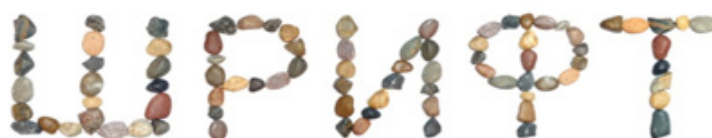
Рис. 5. Акцидентный шрифт