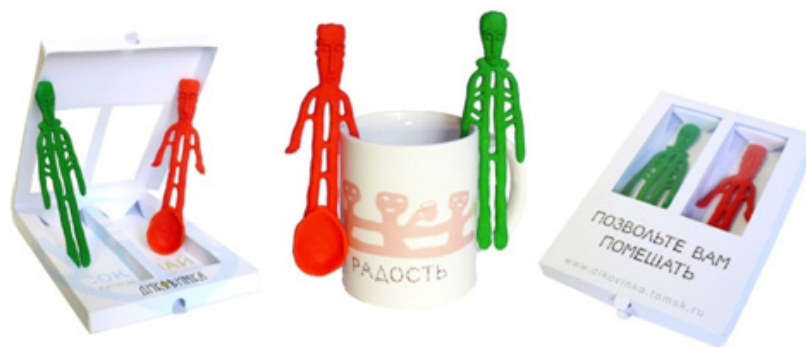
Рис. 7. Набор сувенирной продукции «Позвольте Вам помешать»

Таким образом, итоги реализации экспериментальной образовательной программы позволяют утверждать следующее. Процессы глобализации, с одной стороны, стирают границы и способствуют взаимообмену и взаимообогащению между странами и народами, с другой – возрождается интерес к родной культуре, вопросам культурно-национальной идентичности. Сегодня несомненна актуальность использования воспитательного и образовательного потенциала этнокультуры. Важное значение приобретает разработка образовательных программ, направленных на формирование этнокультурной компетентности.