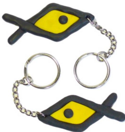
Рис. 3. Брелоки с использованием знака «рыбка» дизайн-студии «Диковинка»

Пластически-образное решение проекта формировалось благодаря непосредственному использованию изображений объектов кулайской культуры, добавлению к этим изображениям дополнительных элементов и разработке новых современных объектов в заданной стилистике. Одним из основных элементов фирменного стиля является логотип. Логотип содержит в себе знак дизайн-студии – рыбку (буква «о» в названии «Диковинка»). Знак «рыбка» – важный смысловой элемент фирменного стиля, является символом плодovitости и изобилия (рис. 3).