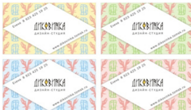
Рис. 4. Визитки дизайн-студии «Диковинка»