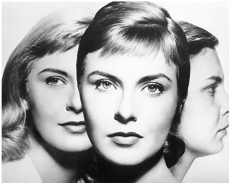
Рис. 3. Визуализация различных личностных состояний (постер к художественному фильму «Три лица Евы» (англ. The Three Faces of Eve) (1957))

Визуализация проявлений трех различных состояний личности представлена на рис. 3.