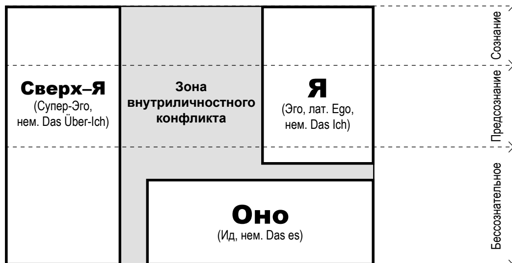
Рис. 1. Структура личности в концепциях фрейдизма и классического психоанализа (И. Л. Шелехов, Г. В. Белозёрова, 2016)

В концепции З. Фрейда личность представляет собой противоречивое единство трех взаимодействующих сфер: «Оно», «Я» и «Сверх-Я», содержание и взаимоотношения которых обуславливают уникальность личности [10–13]. Структура личности в концепциях фрейдизма и психоанализа представлена на рис. 1.