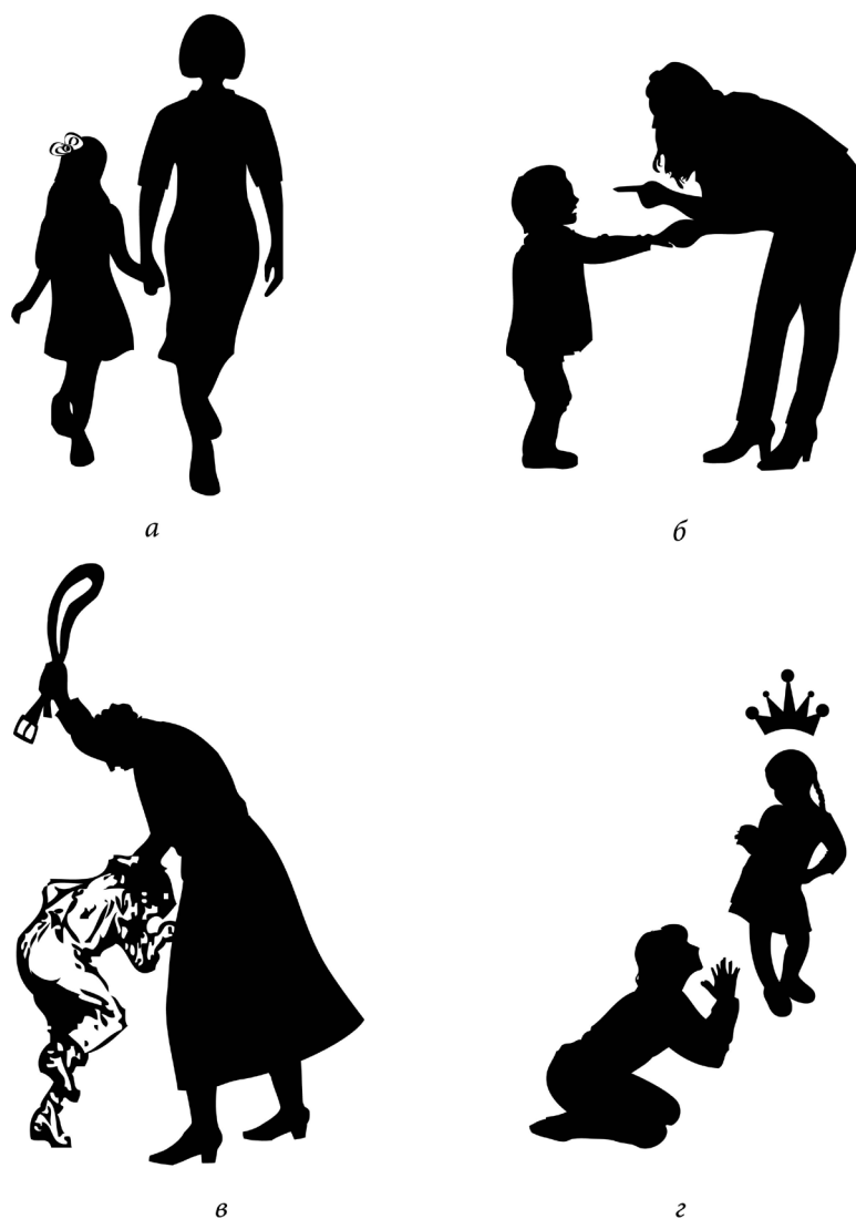
Рис. 2. Основные варианты практической реализации материнства: а – нормативное и условно нормативное материнство; б – нарушения материнско-детских взаимоотношений; в – девиантное материнство (антисоциальная форма); г – девиантное материнство (протосоциальная форма)

В практике выделяются четыре основных режима функционирования системы «мать – ребенок» (рис. 2).